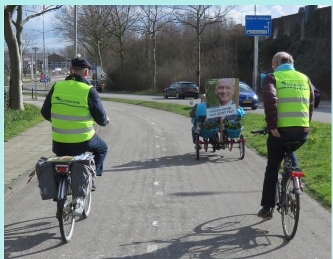
Foto links: Ronde op het Raadhuisplein Foto rechts: Op weg naar H.I. Ambacht