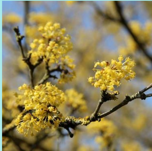
Gele kornoelje ( Cornus mas )

Inheemse soort, goed voor vogels, goed voor vlinders en insecten, mooie herfstkleur, Geurend, verdraagt luchtvervuiling