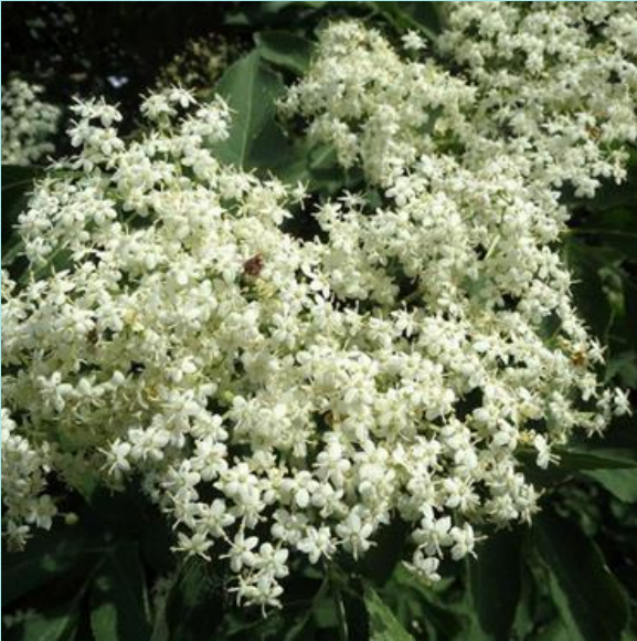
Vlierbes, zwarte vlier ( Sambucus nigra )

We hebben nog bomen over voor de liefhebber. We hebben ze gekregen van een kweker die ze anders had moeten doordraaien.